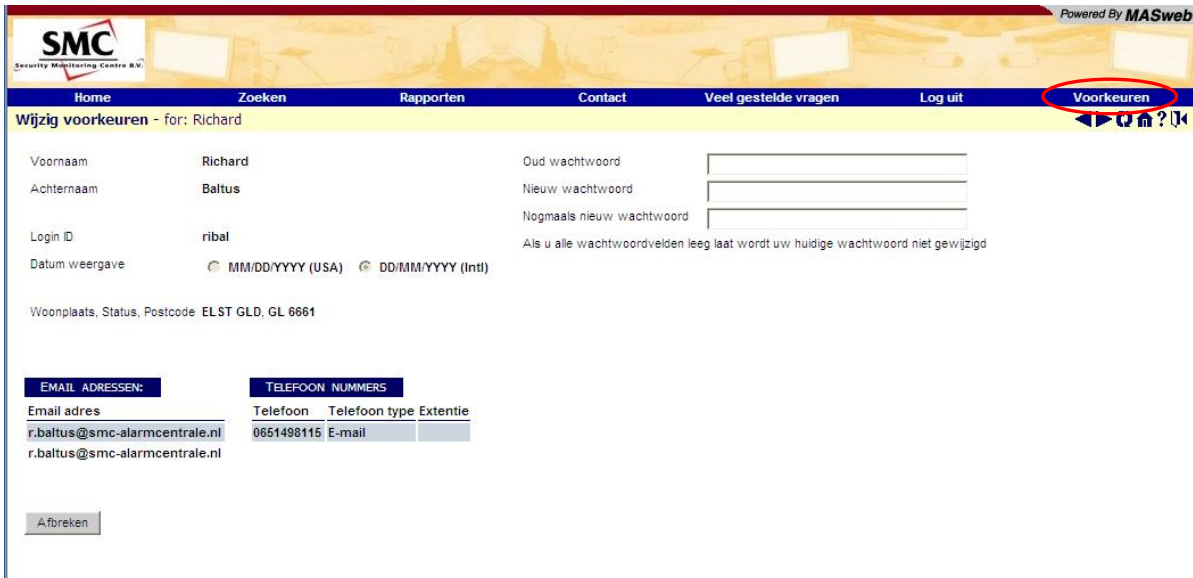
Figuur 13 – Wijzig u wachtwoord

Voer uw oude wachtwoord in, daarna uw nieuwe wachtwoord en vervolgens nog eens uw nieuwe wachtwoord. Klik op 'Opslaan' om het nieuwe wachtwoord op te slaan.