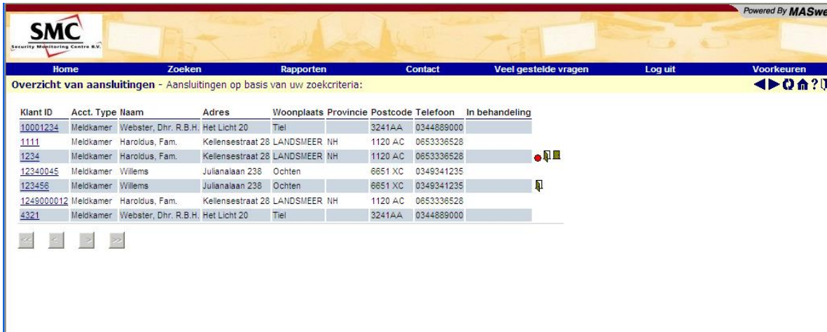
Figuur 5 – Overzicht van aansluitingen

Een symbool naast de tekst van een aansluiting duidt erop dat er een activiteit is voor dat systeem. Ga met de muis op dat symbool staan om de betekenis van het symbool te zien.